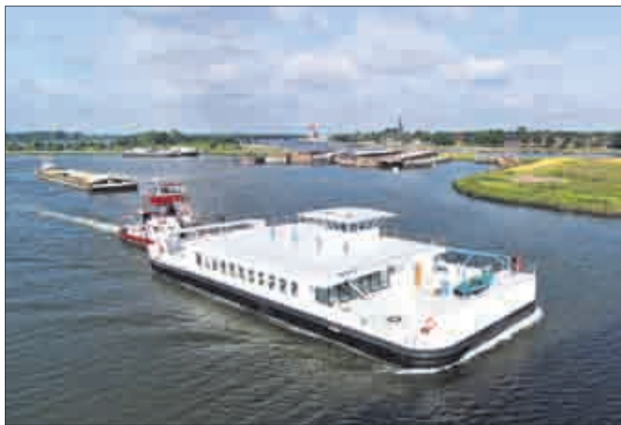
De voormalige veerpont Antoon van Dijk had een ware metamorfose ondergaan toen hij naar Antwerpen vertrok.